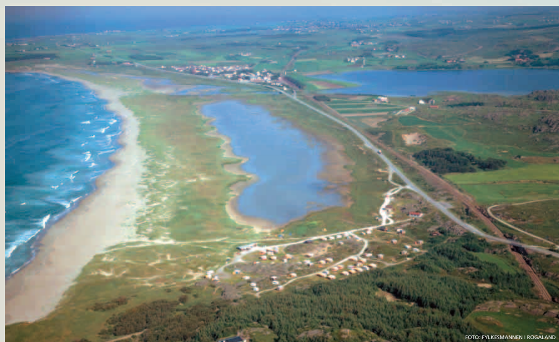
Vaulen er ein stor lagune mellom stranda og riksveg 44 som kom til etter krigen. Brusand camping i framkant av bilete. Bak kan me sjå tettstaden Brusand og Bjårvatnet.

Ved Brusand møter Jærstrendene det knauseste Dalanelandskapet. Bak sanddynebeltet finst ei stor brakkvannslagune, omkransa av tørreng, sump og lynchhei. Laguna heng saman med Fuglestadåna lenger nord.