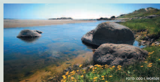
Ved utlaupet av Fuglestadåna. Bekkeblom i forgrunnen.

hand i stordynene og orkideen breiflangre på tørrengene. I våtengene finst orkideane myrflangre og engmarihand. Det unike plantelivet er svært sårbart for trakk. Alle må følgja stiane gjennom området.