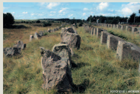
"Hitlertennene" på Brusand vart bygt av tyskarane i 1942 for å stanse stridsvogner.