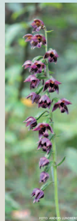
Jærflangre trivst i tørrengene i bakdynene.

Under siste krig frykta okkupasjonsmakta at allierte styrkar skulle gå i land ved Brusand. I 1942 blei det difor sett opp lange rekkjer med stein- eller sementblokker for å stanse stridsvogner. I dag vert desse blokkene kalla for "Hitlertenner". Ved Varden sør i området er det fleire spor etter anlegg frå krigen. Her finst også Varden sjøredningsmuseum med redningsbåten "Tryg" som var stasjonert ved Kvalbein frå 1894 til 1977.